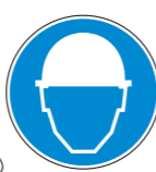
Protección obligatoria de la cabeza