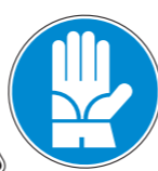
Protección obligatoria de las manos